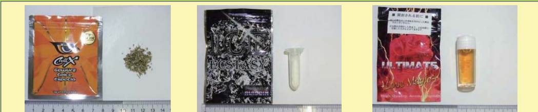
< 様々なタイプ (左からハーブ、パウダー、リキッド) の危険ドラッグ >